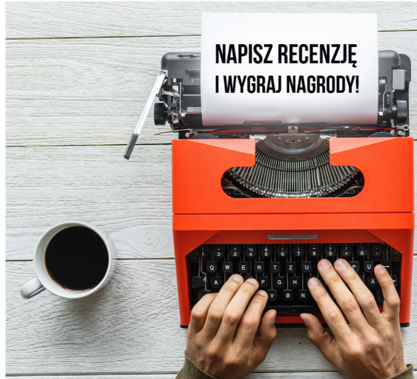
Skład i redakcja: Dział Promocji i Dział Literacki Polkowickiego Centrum Animacji, ul. Skalników 4, tel. 76 746 88 15, www.pca.pl